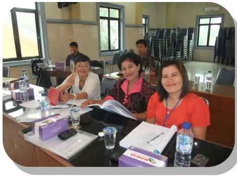
信義宗研究中心于印尼棉蘭研討會， 4月16-17日