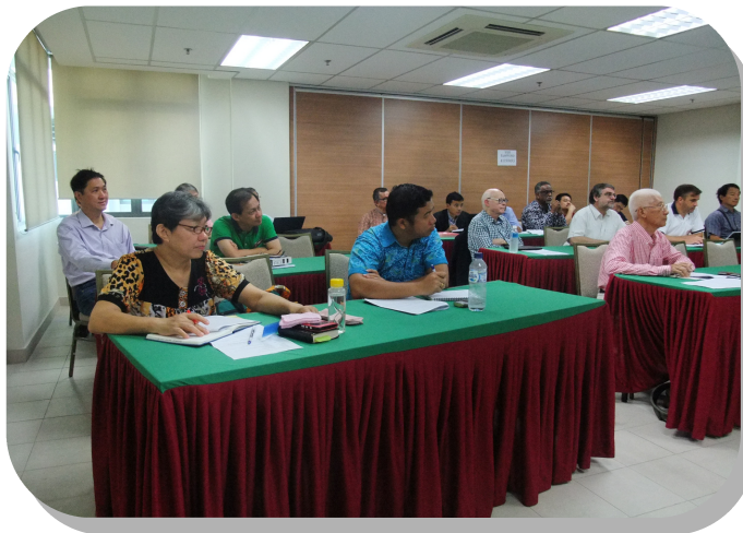
信义宗研究中心于八打灵再也研讨会，4月13-15日

-17日）。研讨会主题是“介绍信义宗论理”，与会者超过六十人，另外还有许多神学院的学生参加部分的研讨会。对于许多与会者，这是他们第一次有机会听到关于路德对‘社会参与是基督徒生活的一部分’的见解。与会者分成小组阅读和讨论了路德的著作“基督徒的自由”。主讲人讲座涉及的主题，如从律法和福音的关联性区分社会行动，信义宗了解的“两个王国”，和路德神学中社区的角色。