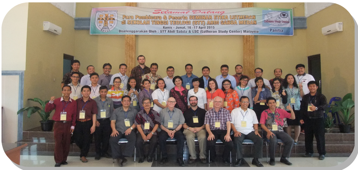
信义宗研究中心于印尼棉兰Abdi Sabda 神学院主办“介绍信义宗论理”研讨会，4月16-17日