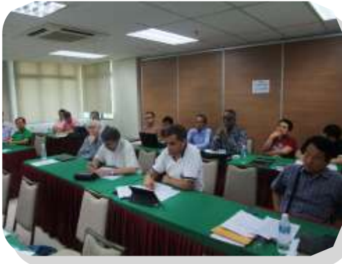
LSC KL seminar 13-15 April 2015