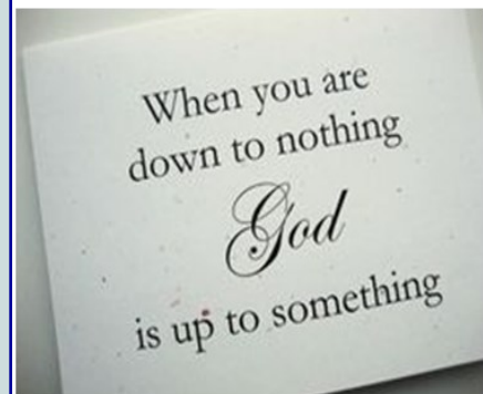
Gambar: Apabila anda hilang kesemuanya, Tuhan sedang melakukan sesuatu.

Ditulis oleh Rev. Wendolyn Trozzo, Penyelaras Jangkauan Berjemaah untuk Lutheran Study Centre di STS